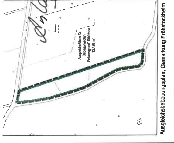
Ausgleichsbebauungsplan, Gemarkung Fröhstockheim