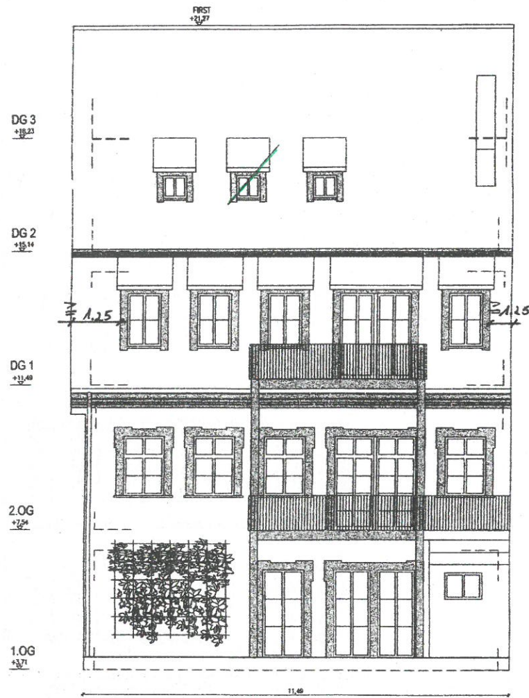
ANSICHT- HOF M 1:100