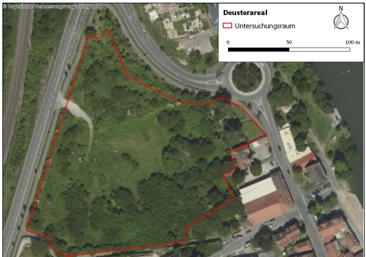
Abb. 1: Übersicht des Untersuchungsgebietes

Das Staatliche Bauamt Würzburg plant die Änderung des bestehenden Bebauungsplans auf dem Gelände des ehemaligen „Deusterareals“ in Kitzingen für den Neubau eines Archivgebäudes für die staatlichen Archive Bayerns (vgl. Abb. 1). Das Plangebiet befindet sich am nördlichen Rand von Kitzingen und ist ca. 2,1 ha groß. Es besteht zum Teil aus brachliegendem, verbuschtem Grünland, in den Randbereichen bzw. im Norden ist das Plangebiet großflächig mit verschiedenen jungen Gehölzbeständen und einer großen Kastanie bewachsen. Außerdem befinden sich zwei kleine Gewässer und eine Zisterne auf dem Gelände. Durch die geplanten Änderungen sind sowohl die Gewässer, die Offenlandbereiche als auch die Gehölze betroffen. Ein Eingriff in Natur und Landschaft ist demzufolge unvermeidlich, so dass eine spezielle artenschutzrechtliche Prüfung (saP) zu erstellen ist.